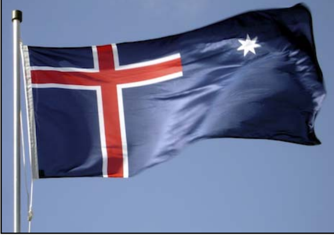
దేవుని రాజ్య పతాకము (20 వ పేజీ చూడండి)