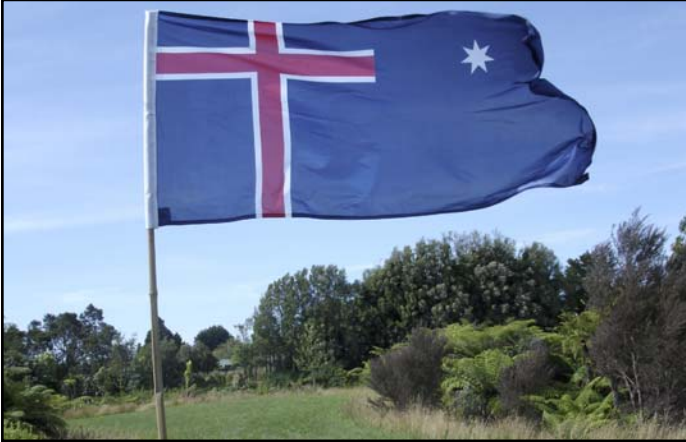
దేవుని రాజ్య ప్రమాణిక ధ్వజం (20వ పేజీ చూడండి)